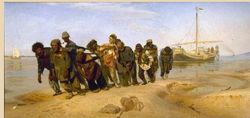
Ілля Рєпін. Бурлаки на Волзі

Реалізм (від лат. realis — «суттєвий, дійсний») — художній напрям, представники якого прагнуть зображувати життя таким, яким воно є, в образах, що відповідають явищам самого життя.