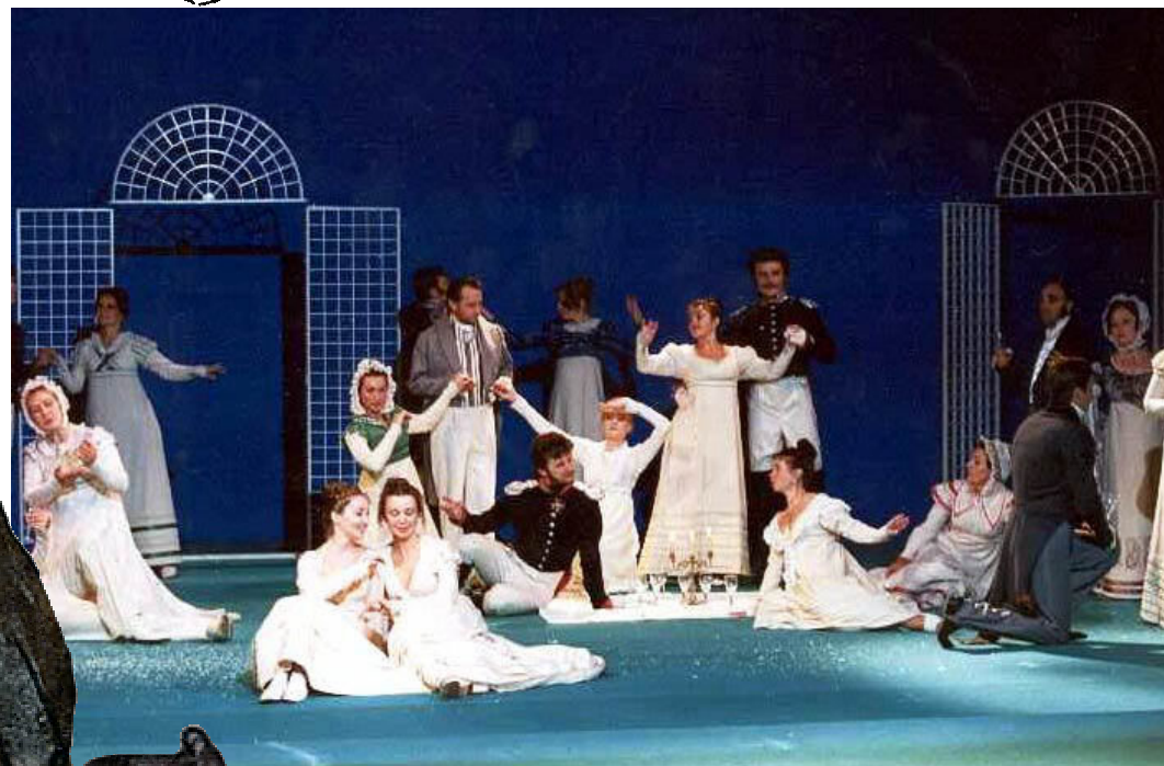
Сцена з опери П. І. Чайковського «Євгеній Онегін» у постановці московського театру «Нова опера».