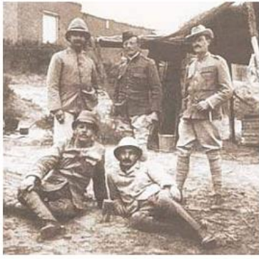
Р. Кіплінг серед кореспондентів у Південній Африці

елітний заклад — Юнайтед Сервіс Коледж, де готували «слуг Британської імперії». Однак Редьярда не приваблювала військова кар'єра. Він захопився літературою. В юнацькі роки почав писати вірші, посилав їх у журнали. На жаль, їх не друкували. Батьки оцінили їх належно набагато раніше, ніж професійні редактори. У 1881 р., коли Редьярдові виповнилося 16 років, вони видали власним коштом його збірку «Шкільні вірші», а на закінчення навчального закладу допомогли синові влаштуватися на роботу в газету. У 17 років Кіплінг повернувся в Індію й став працювати репортером «Цивільної та військової газети».