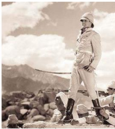
Кадр із кінофільму «Ганга Дін». Режисер Дж. Стівенс. 1939 р.

Дослівно перша фраза балади перекладається так: «Захід є Захід, а Схід є Схід, з місця вони не зійдуть», але весь текст доводить думку про те, що, хоча Захід і Схід ніколи не зрушають з місця, людина з людиною, незважаючи на різницю в поглядах, національну й релігійну належність, завжди можуть порозумітися й зблизитися духовно. Це шлях до духовного єднання людства, від чого залежить доля Землі. Світосприйняття письменника відзначається особливою толерантністю. Він утверджував думку про те, що немає Заходу без Сходу, а Сходу — без Заходу, що всі частини поєднуються в одному цілому, що світ різнобарвний і багатолікий, тому завдання справжньої людини — увібрати, зрозуміти, поважати й полюбити це розмаїття.